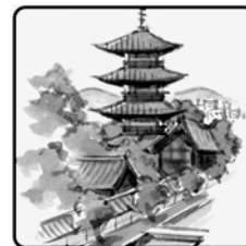
完歩記念バッジ (メダルピンバッジ)