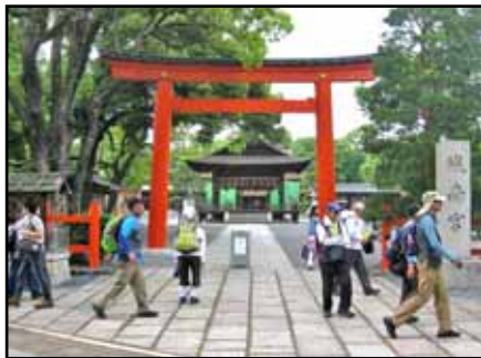
城南宮 (熊野詣 出立の地)

新日吉神宮に参拝し、高台寺公園で昼食休憩。午後は円山公園を通り抜け南禅寺から熊野若王子神社を訪れ、聖護院門跡から最後は熊野神社に参って、丸太町橋にゴールしました。