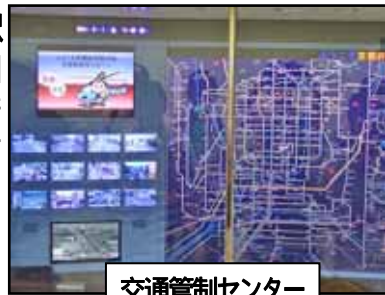
交通管制センター

集合：8:45(9:00出発) JR嵯峨野線二条駅 ゴール：12:30頃 地下鉄・丸太町駅 コース：JR二条駅 ～二条公園～堀川 遊歩道～京都府 警察本部～地下 鉄・丸太町駅 参加費：300円